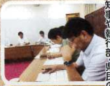
知事や執行部・県民の方々と県政のあり方について協議