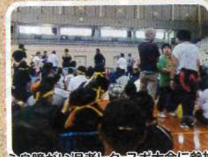
心身障がい児者レク・スポ大会に参加