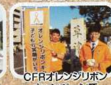
CFRオレンジリボンキャンペーンで今年も啓発応援!!