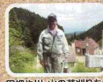
田畑や川・山の草刈りも日常の仕事