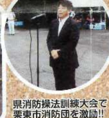
県消防操法訓練大会で栗東市消防団を激励!!