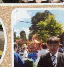
春の例大祭を巡る