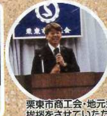
栗東市商工会・地元金勝生産森林組合総代会で挨拶をさせていただく