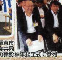
念願の栗東市学校給食共同調理場の建設神事起工式に参列