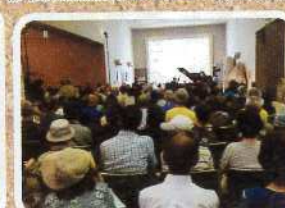
栗東音楽振興会長として毎月音楽文化事業を運営参画する