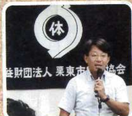
県体栗東選手団結団壮行会で激励