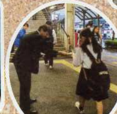
朝の駅頭活動も11年目を迎える