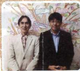
子どもNPOセンター福岡で貧困対策研究(長阿彌所長と)