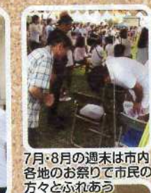
7月・8月の週末は市内各地のお祭りでも市民の方々とふれあう