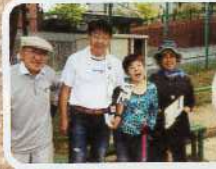
グラウンドゴルフ・観光物産協会・シルバー人材センターの皆さんと一緒に!!