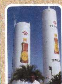
夏休み各地を歩き、地産地消の国際的産業育成や文武両道の教育について勉強する