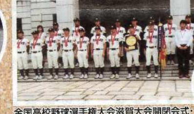
全国高校野球選手権大会滋賀大会開閉会式・彦根東激協会にスポーツ講演副会長として参列