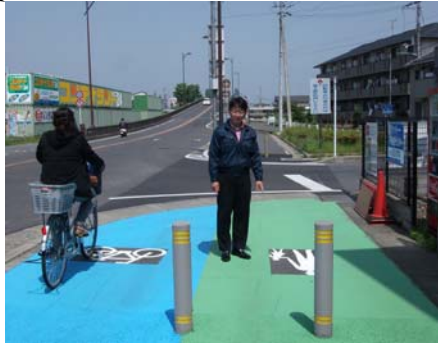
苅原交差点前 歩道・自転車道区分整備 歩道(緑色)・自転車道(青色)に区分