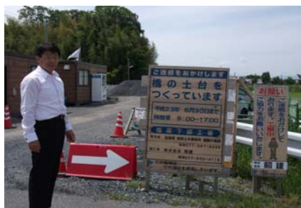
河川改修工事に伴う、県道六地蔵草津線整備(下戸山地先)