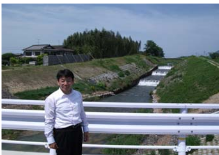
岡地先・高井川橋付近