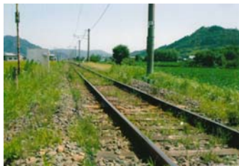
林地区にて 平成20年10月撮影