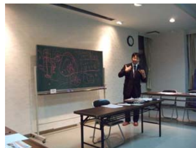
川辺自治会館にて9月滋賀県議会の県政報告会開催(10/1)