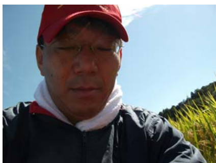
金勝で清流米を稲刈り。猛暑の為不作？地産地消の農業施策の拡大へ