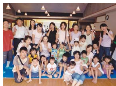
なかよしまつりで市民の皆さんと共に！！(なかよし作業所にて)

県政を身近に感じませんか？くのり学による滋賀県政の報告会ご希望の方は ご一報下さい。どこでも行きます！！