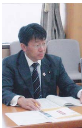
県内各団体の要望事項を来年度予算に反映するためヒアリング(県庁内)(11/8・12及び15~16)