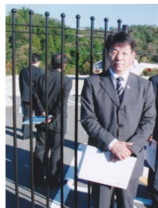
公立豊岡病院(兵庫)へドクターヘリの滋賀県への導入の必要性を視察調査(11/4~5)