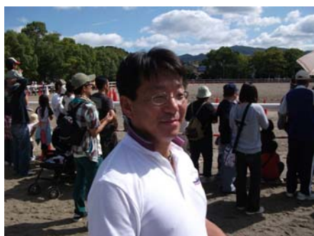
10/11(祝)第30回の記念すべき『栗東・馬に親しむ日』に家族と参加。レース鑑賞