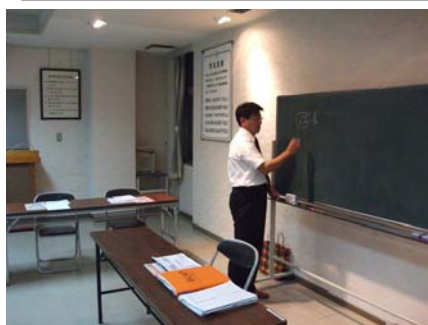
県政報告会で県の高齢者施策と特産物について熱く語る！(コミセン大宝西 10/6)