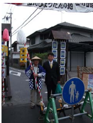
目川ほっこりまつりに参加(10/24)